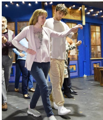
Auch das Tanzen will geübt sein.